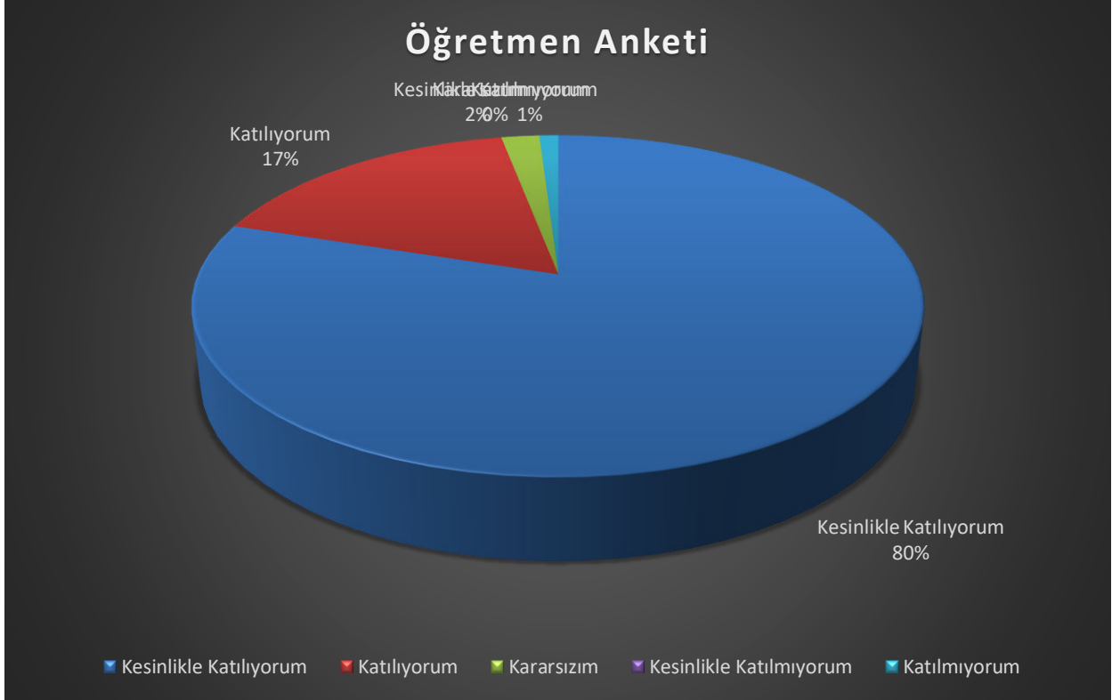
Şekil 2. Öğretmen Anketi Grafiği

Okulumuzda görev yapmakta olan toplam 7 öğretmenin tamamına uygulanan anket sonuçları aşağıda yer almaktadır.