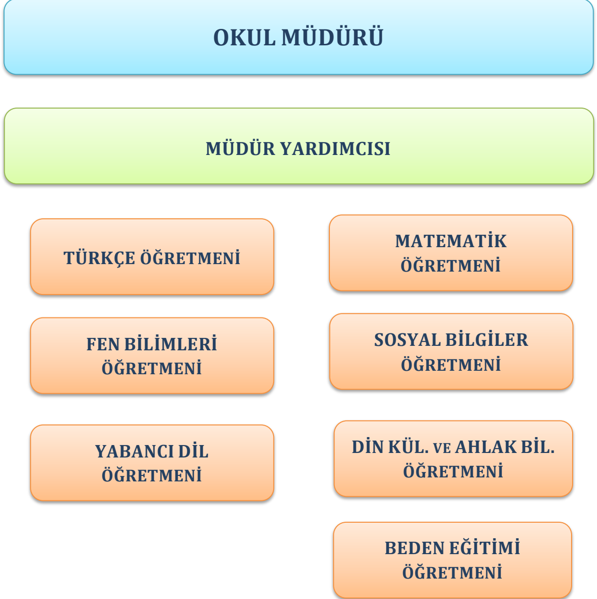
Şekil 4. Şenyurt Ortaokulu Teşkilat Yapısı

Okulumuzun teşkilat yapısına baktığımızda ise kurumumuzun tüm faaliyetlerinden sorumlu okul müdürü onun da altında okulun tüm faaliyetlerini yürüten 1 müdür yardımcısı, 2 okulöncesi öğretmeni ve 4 sınıf öğretmeni olduğunu aşağıdaki şemada görmekteyiz.