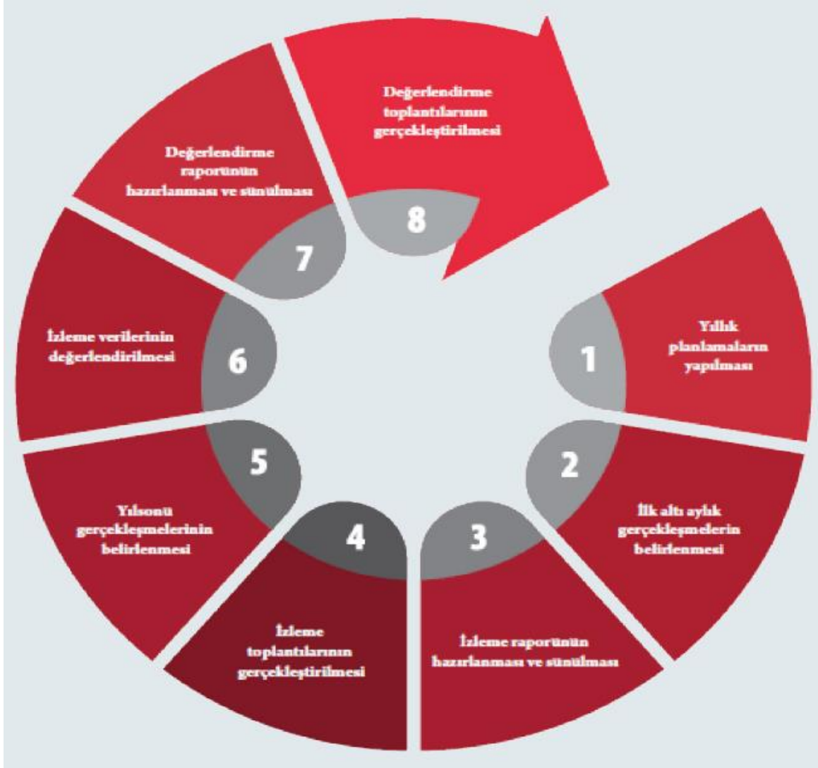
Şekil 5: İzleme ve Değerlendirme Süreci

Yılın tamamına ilişkin ikinci izleme kapsamında ise harcama birimlerinden sorumlu oldukları performans göstergeleri ve stratejiler ile ilgili yıl sonu gerçekleşme durumlarına ait veriler toplanarak raporlanacaktır. Stratejik Plan Değerlendirme Raporu, üst yönetici başkanlığında yapılan değerlendirme toplantısında stratejik planın kalan süresi için hedeflere nasıl ulaşılacağına ilişkin alınacak gerekli önlemleri de içerecek şekilde nihai hâle getirilecektir. Hedeflerin ve ilgili performans göstergeleri ile risklerin takibi, hedeften sorumlu birimin harcama yetkilisinin; hedeflerin gerçekleşme sonuçlarının harcama birimlerinden alınarak raporlaştırılması, analizi, değerlendirilmesi ve üst yöneticiye sunulması sağlanacaktır.