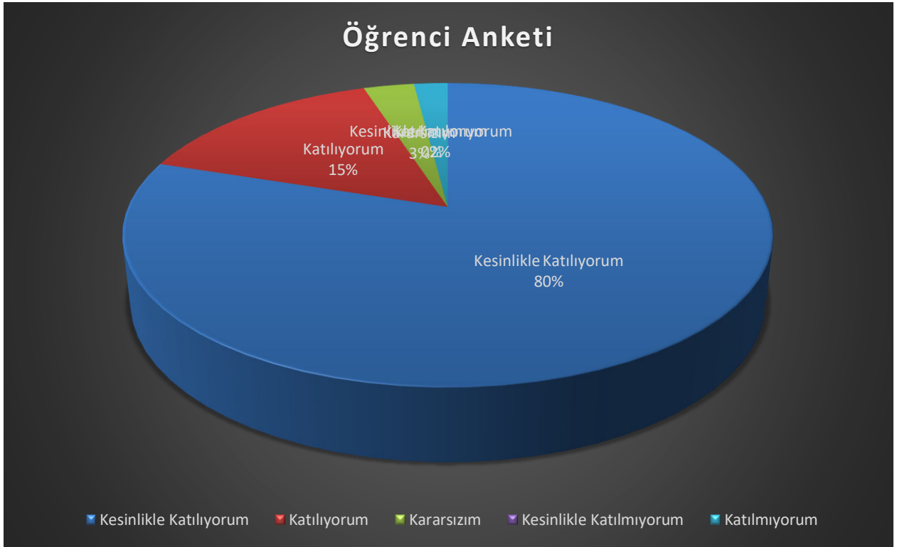
Şekil 1. Öğrenci Anketi Grafiği

Okulumuzda toplam 63 öğrenci öğrenim görmektedir. Tesadüfi Örneklem Yöntemine göre seçilmiş toplam 63 öğrenciye uygulanan anket sonuçları aşağıda yer almaktadır.